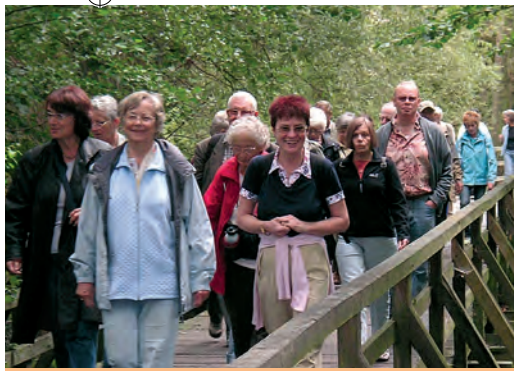
Wanderung Tegeler Fließ