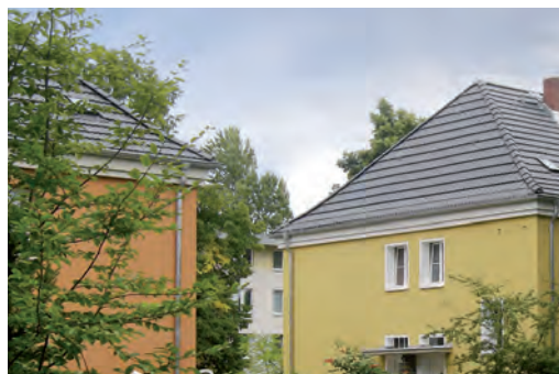
Nach der Fassadensanierung an der Goerzallee

An den folgenden Grundsätzen lassen wir uns gemeinsam messen.