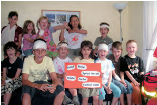
1. Hilfe Kurs für Kinder in Rudow

Wer in der bbg Mitglied ist, wohnt sicher wie ein Eigentümer und flexibel wie ein Mieter. Wir unterstützen unsere Mitglieder umfassend, indem wir attraktiven und sicheren Wohnraum zur Verfügung stellen, der seinen Preis wert ist. Rund ums Wohnen bieten wir guten Service durch Beratung und aktive Hilfe. Wir verstehen soziale Herausforderungen als gemeinsame Aufgabe und suchen auch mit unseren Netzwerkpartnern nach Lösungen.