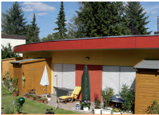
Neubau WA 71 in der Goerzallee