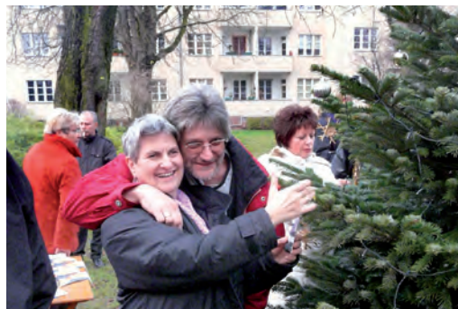
Weihnachtsbaumschmücken in der Wohnanlage Äneasstraße