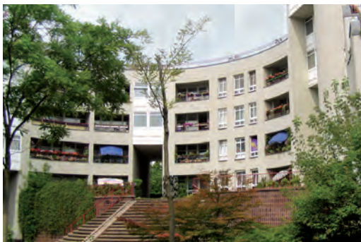
WA 5 „Schnecke“ in Buckow

Sind unsere Mitglieder zufrieden, sind wir es auch.